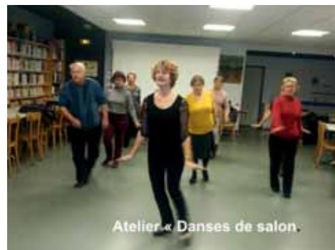
Atelier « Danses de salon »

La rentrée 2013 a vu arriver une nouvelle animatrice de danses et salon, et, la création d'un deuxième atelier « vélo ». En effet, suite au départ de la région de notre animateur de danses de salon, comme nous ne voulions pas voir cette activité disparaître, nous avons lancé un