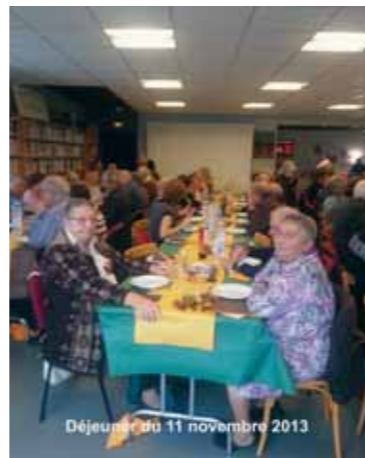
Déjeuner du 11 novembre 2013

Le déjeuner du 11 novembre a toujours le même succès. C'est dans une ambiance conviviale et chaleureuse que le repas « maison » s'est déroulé. Les tables à peine débarrassées, ce sont les joueurs de cartes et de scrabble qui se sont installés pour poursuivre agréablement l'après-midi.