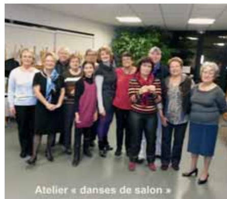
Atelier « danses de salon »

nons rendez-vous au foyer le mercredi à partir de 18 heures 15 (la salle de danses n'étant pas disponible), pour apprendre et se détendre dans une ambiance très chaleureuse.