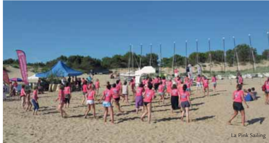
La Pink Sailing

La programmation musicale éclectique est toujours très appréciée à La Palmyre et les nouveautés de cette année (humour, théâtre...) ont rencontré un vif succès. Les spectacles interactifs organisés dans la rue ont également trouvé leur public et nous espérons pouvoir les renouveler l'an prochain. Comme chaque année, la saison s'est terminée par le Raid Aventure autour de la Baie de Bonne Anse. Cette 5ème édition a rassemblé tout autant de participants que l'édition précédente et ceux-ci ont pu se dépasser en admirant les paysages de notre commune sous un ciel clément. « Après l'effort, le réconfort » les compétiteurs, organisateurs et spectateurs se sont ensuite retrouvés autour d'un repas convivial à l'Espace Multi-Loisirs aux Mathes pour clôturer cette journée sportive.