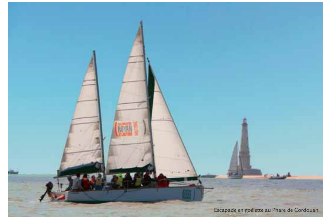
Escapade en goélette au Phare de Cordouan

Les travaux d'agrandissement des locaux de l'Office ont débuté comme prévu au 1er octobre 2013 et doivent se poursuivre jusqu'en mars 2014. L'Office de Tourisme reste bien entendu ouvert pendant toute la durée des travaux et nous sommes à votre disposition aux horaires