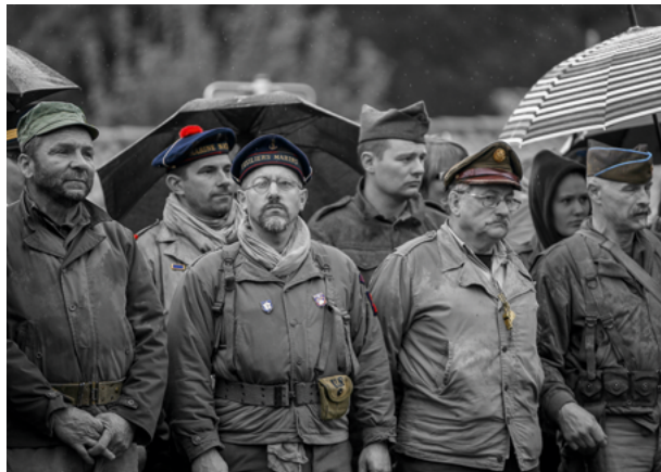
Le Groupe de Conservation de Véhicules Militaires du Sud-Ouest.