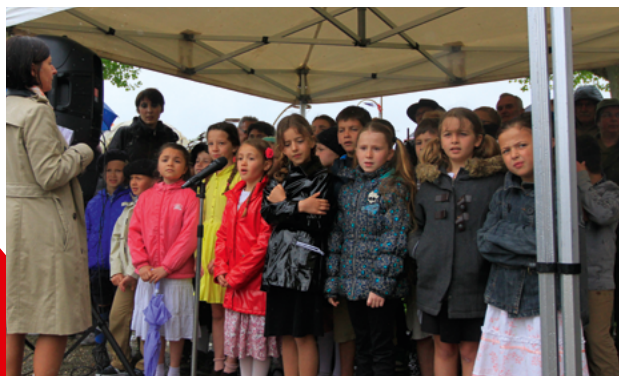
Les enfants des écoles et leurs enseignantes.